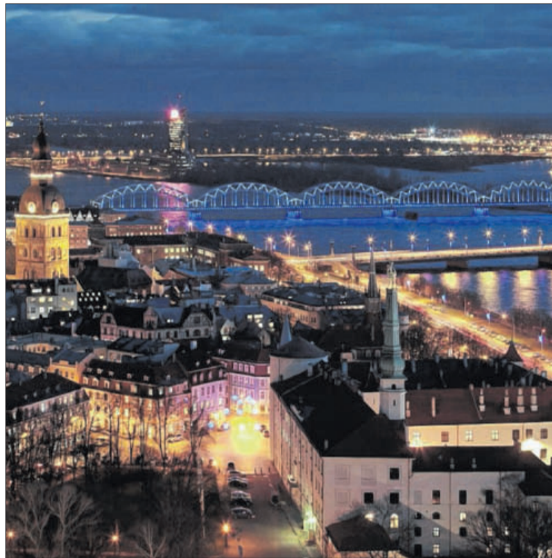
Blick auf das abendlich beleuchtete Riga. Die lettische Hauptstadt ist 2014 europäische Kulturhauptstadt. Die Altstadt gehört zum Unesco-Weltkulturerbe.